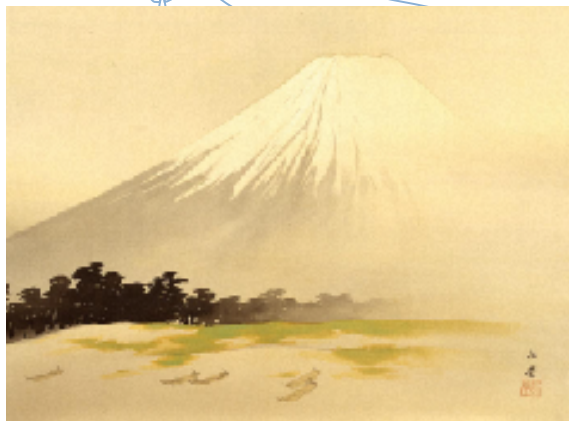
川合玉堂「田子の浦」